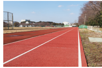
完成した陸上競技場

定書に基づき、オリンピック・パラリンピック競技大会機運の醸成等を目的とした連携に取り組んでおります。