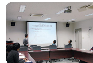
学外研究者を招聘し、小規模の研究会を頻りに開催している

2007年の金融危機とそれに続く不況、2011年の震災とそれに続く原発事故は、リスクと不確実性の重要性を再認識させています。本研究拠点では、不確実性下の意思決定の基礎理論研究を推進するとともに、金融、電力、労働、結婚などの様々な市場におけるリスクと不確実性に関する実証研究、応用理論研究を遂行し、経済におけるリスクと不確実性の研究を総合的に推進します。