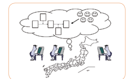
人間プレーヤとコンピュータエージェントが競争・協調しながら、企業経営を実験・評価する

現代企業は、市場環境の急激な変化に対応して成長していくために、サプライチェーンマネジメントやサービスイノベーションを始めとして、更にそれらに続く新しいビジネスモデルを創造していくことが求められています。そこで、クラウド型のコンピュータ環境上に、ビジネスシミュレーションのためのプラットフォームとなるシステムを開発、ビジネスモデルの実験と評価を行います。