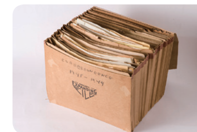
シャープは書簡など多くの資料を、自ら丁寧に整理した。目下データベースを作成中である

横浜国立大学は、戦後日本の税制設計に貢献したカール・シャープ博士 (1902-2000) のコレクションを中央図書館に所蔵しています。戦前以来の税財政をめぐるアメリカのアイデアの国際的展開を探る上でも貴重な資料であり、2009年には英米の研究者の参加を得てシンポジウムを開催しました。500箱を超える原資料の整理解析を継続しつつ、その資料を活かして現代各国の税財政問題にも視野を及ぼす国際的な研究ネットワークを展開します。