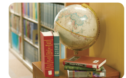
アジアを中心とする世界各国の経済社会統計を整備している

アジア経済社会統計研究拠点は、概算要求特別経費の支援を受けて始動した経済学部附属アジア経済社会研究センターの研究活動の一環として、2012年4月に設置されました。独自のデータベース「アジア社会統計データベース (EADP)」・「アジア国際産業連関データベース (YNU-GIO)」(2013年春予定) の公開に加えて、「産業別実質実効為替レート」のデータベースを経済産業研究所と共同で構築・公開しています。