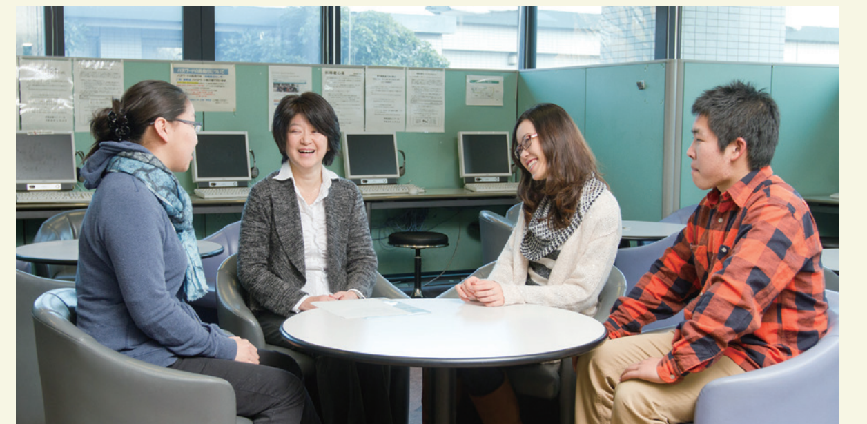
留学生センター1階ロビー。学生達の交流の場となっている

日本とは異なる文化的背景をもつ留学生と議論を交わし、一緒に学ぶことで、日本人学生はさまざまな気づきを得られ、留学の動機づけになったり、留学から帰国後、次へのステップにむかう動機づけになっています。留学生センターはキャンパスの端に立地していますが、ここがYNU全体の国際化の入口となるように、常に開かれた存在を目指したいと思っています。