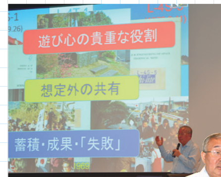
役の川泰宣氏はJAXA技術参与・名誉教授で小惑星探査機「はやぶさ」プロジェクトのメンバー