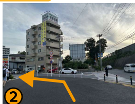
右側の横断歩道を渡らず、歩道に沿って左へお進み下さい。