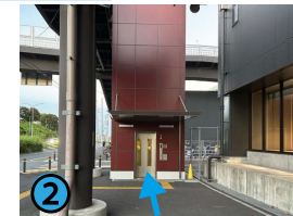
エレベーターに乗って2階に上がります。前後方向にドアがついておりますので前から入り、降りたら右に渡って橋をお渡り下さい。