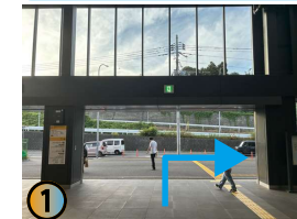
改札を出たら右へお進み下さい。