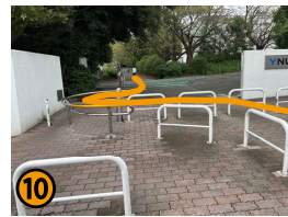
左手に西門が見えたら、オレンジ線のように車いすゲートを通して大学に入ることができます。