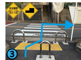
横断歩道を渡って右にお進み下さい。