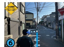
交差点を左に曲がります。右手の「止まれ」の標識と左奥の黄色い壁の家が目印です。