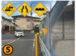
橋を渡り、突き当たりを右に曲がります。橋の上は白線の外側が大変狭く、車通りも多いので十分お気をつけて走行して下さい。