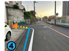
最初の曲がり角を左に曲がります。その先は急勾配の坂道になっております。