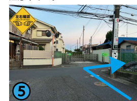
坂道を登り切ったら、突き当たりを右に曲がります。この先は道幅が狭いほぼ平坦な道を約465m進みます。