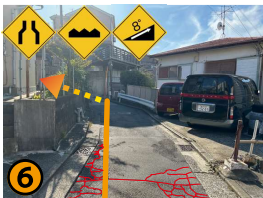
突き当たりを左へお進み下さい。この道路は狭くひび割れもあり、視界が悪いため車にはご注意ください。