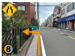
左に曲がります。右手の青いクリーニング屋さんが目印です。車通りが多い道路ですので、お気をつけて走行して下さい。