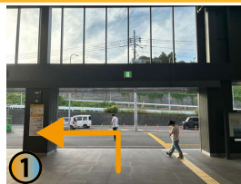
改札を出たら左へお進み下さい。