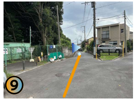
真っ直ぐ進みます。ここから先は下り坂になっております。