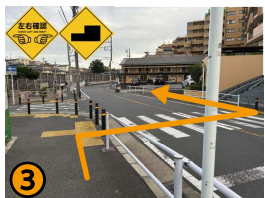
横断歩道を渡ります。車通りが多く、歩道と車道の境に段差があるのでご注意ください。