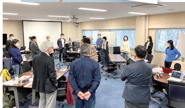
前回（2023年3月）開催の様子

PELUMBRA LTD CONSULTANCY FOR WORLD THINKERS