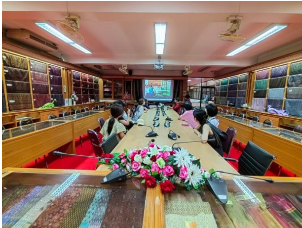
専門家によるタイシルクの歴史等の講義を拝聴