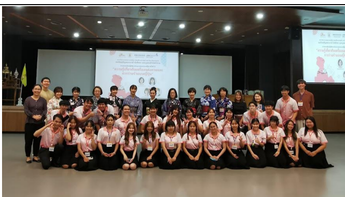
スタッフとの集合写真