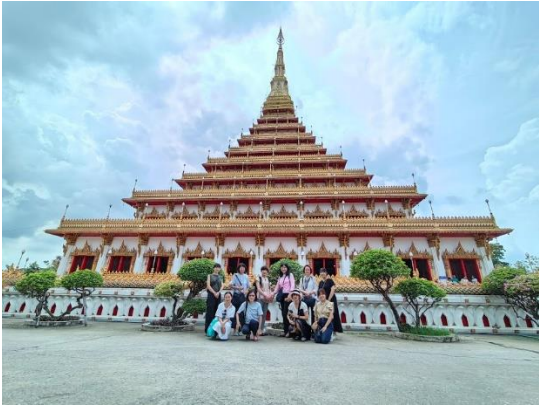
ノンウェーン寺院の見学