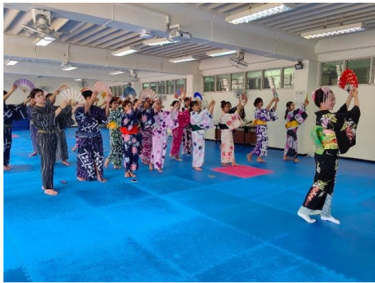
見立てワークに挑戦-示範をまねる学生たちの様子