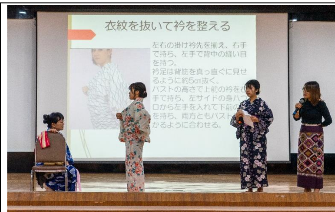
女物のゆかたの示範