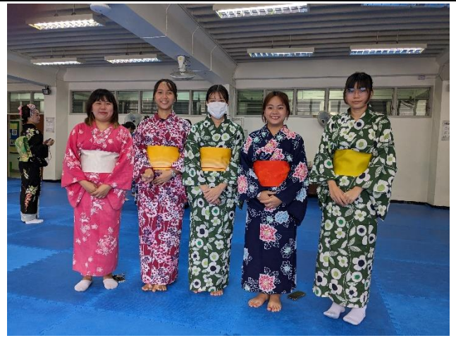
着装後の記念撮影