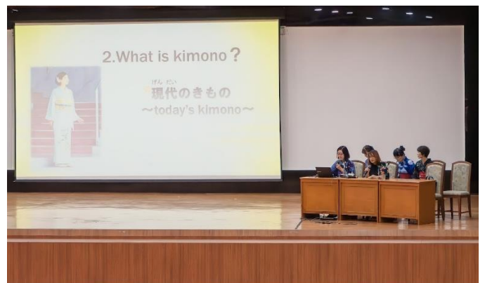
きもの文化の紹介