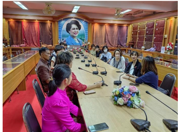
講義後の質疑応答