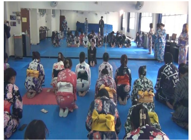
見立てワークの最初の挨拶