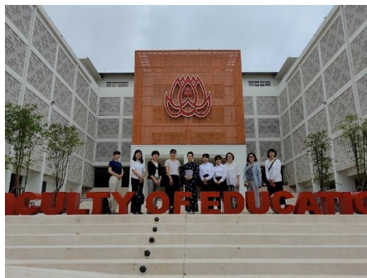
コンケン大学教育学部の校舎の前で集合写真