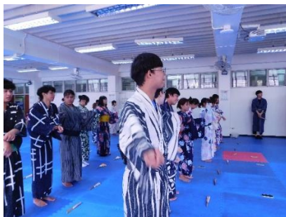
示範をまねる学生たち