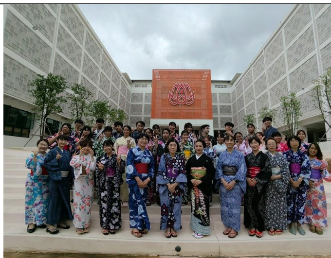
教育学部の中庭での記念撮影 1