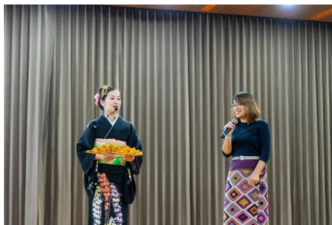
見立てのレクチャとワッチャラー先生の逐次通訳