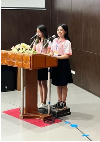
ワークショップの事前紹介