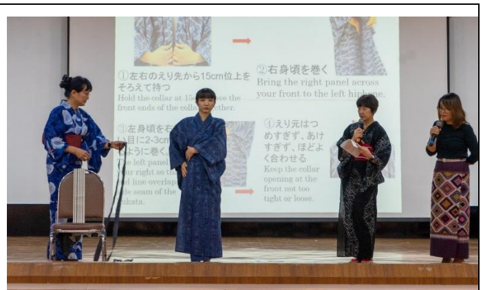
男物のゆかたの示範