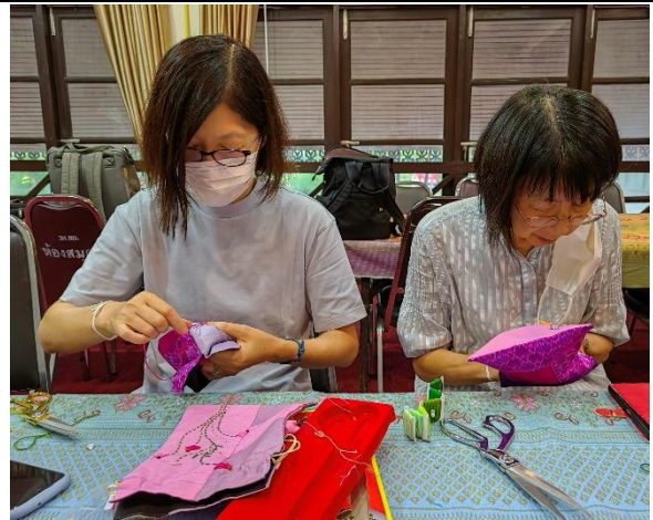
タイシルク巾着の飾り刺しゅう体験