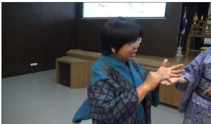
タイ東北地方の生地の手作り浴衣で参加された参加者