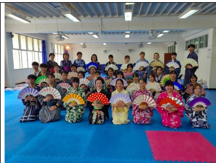
参加者と記念撮影