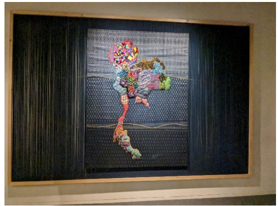
シルキット女王博物館の展示品の例