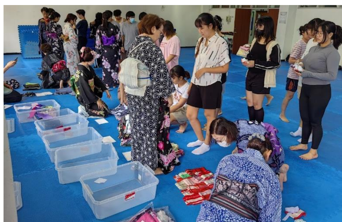
好みの柄のゆかたの選択