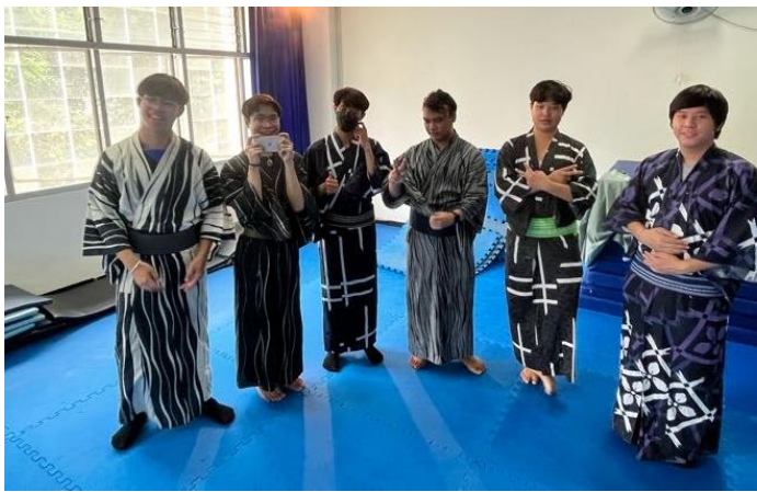
着装後の記念撮影