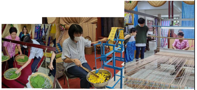
シルク村の見学ー蚕、まゆの製糸や機織体験の様子