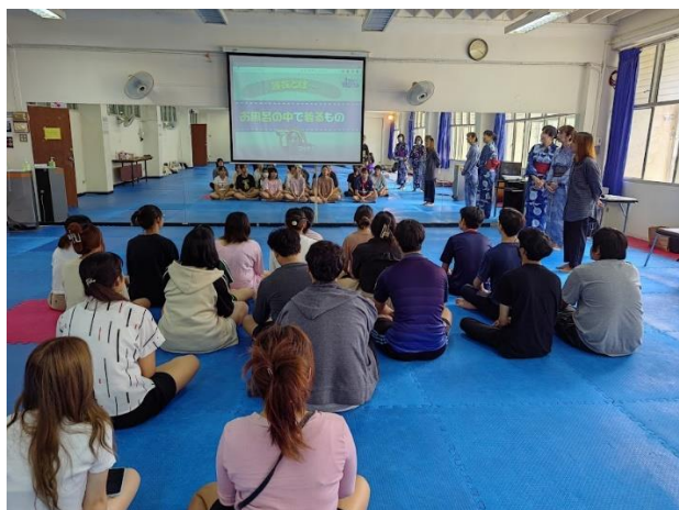
ゆかたに関するミニレクチャ視聴