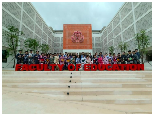
教育学部の中庭での記念撮影 2