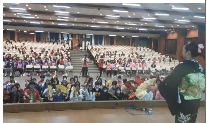
見立てワークを真似る参加者