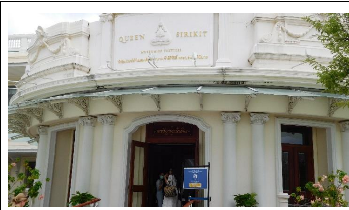
シルキット女王博物館