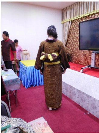
タイシルクのきものを着付けしたところ