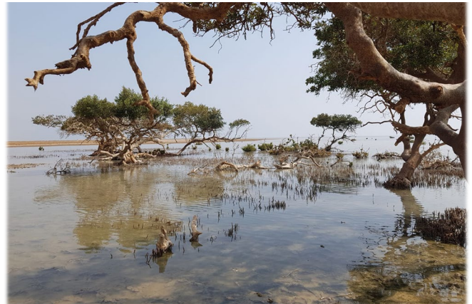
石垣島（左）とスーダン国モハマドゴル（右）のマンングローブ林