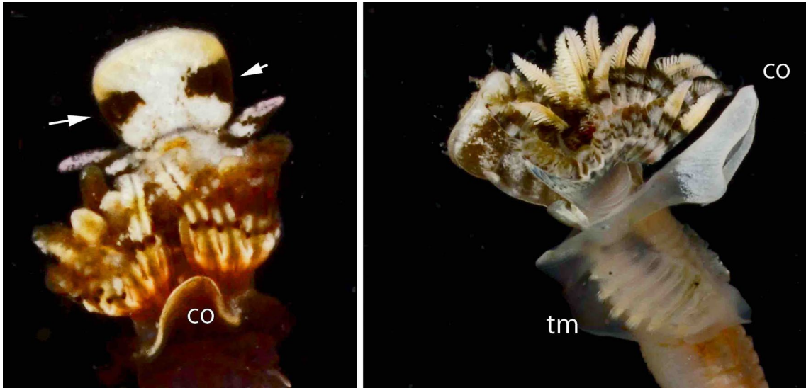
図2。ヤッコカンザシの体前部の拡大（左は腹面、右は側面）。左図の上から殻蓋、鰓、襟膜、胸部と続く。矢印は殻蓋腹面にある模様を指す。co は襟膜、tm は胸膜を示す。Nishi et al (2022)の図4を改変。