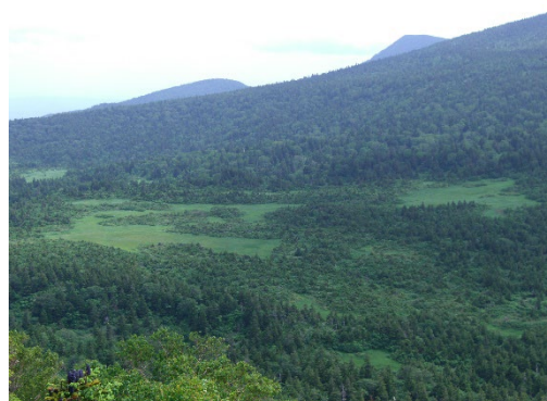
写真1. 八甲田山系の湿原群. 森林に囲まれて点在しているのが湿原.

近年、野外の生態系において、物質の生産や分解などの基盤的な生態系機能を持続的に維持するためには、生物多様性が不可欠であることが明らかになりつつあります。山岳域や寒冷地の湿原生態系（写真1）は、世界の陸地に占める面積は少ないものの、低温・過湿条件によって植物が分解されずに堆積するため、地球規模の炭素吸収源として期待されています。しかし、炭素循環に関わる湿原の機能に果たす地上部と地下部の生物多様性の役割はまだよくわかっていません。