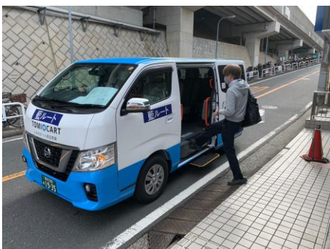
昨年度の実証実験の様子