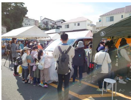
カーペイントの様子