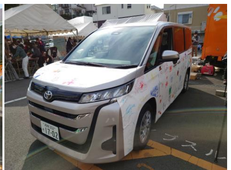
カーペイント後の車両