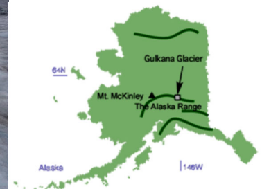
図1 微生物の調査を行った米国アラスカのグルカナ氷河（2015年8月）。黒っぽく色づいている氷は藻類の繁殖によるもの。