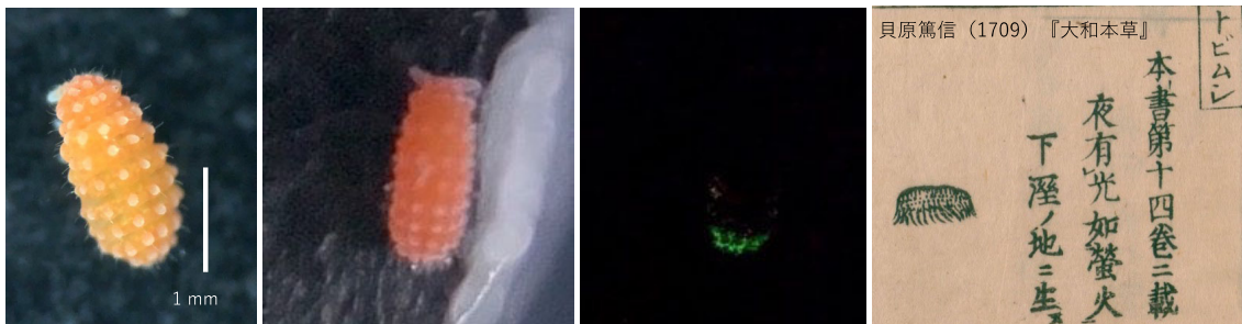
アミメイボトビムシ属の一種 ( Vitronura giselae ) とその発光している様子