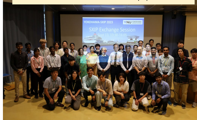
Photo of YOKOHAMA-SXIP International Symposium 2023