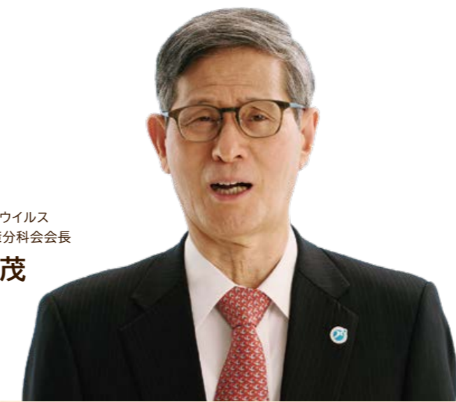
新型コロナウイルス 感染症対策分科会会長 尾身 茂