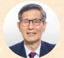
新型コロナウイルス 感染症対策分科会会長

差別や偏見、嫌がらせが広がると医療従事者やエッセンシャルワーカーの離職が増える可能性があります。また、感染者への同様のことが増えると検査を避けたり、感染を隠そうとする人が増え、感染拡大を抑えにくくなります。